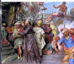
centaines de fresques et de sculptures.

► Sacro Monte , balade d'environ 1 h 30 depuis Orta. www.sacromonteorta.it