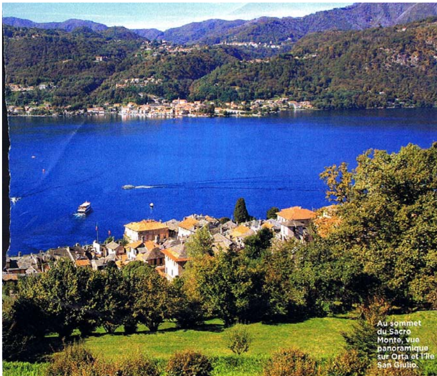
Au sommet du Sacro Monte, vue panoramique sur Orta et l'île San Giulio.