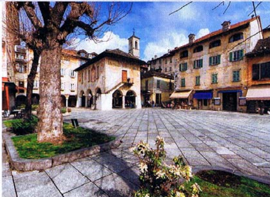
Tous les chemins mènent à Piazza Motta, au centre d'Orta.

C'est sur la place Motta, au bord de l'eau, que convergent tous les promeneurs, souvent une glace à la main. La vue sur l'Isola San Giulio est magnifique, avec les barques au premier plan. Si l'on tourne le dos au lac, autre spectacle: les maisons aux façades couleur ocre, crème ou rouge, quelques fresques sur les